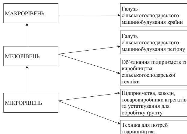
Рис. 2. Структура рівнів конкурентоспроможності сільськогосподарського машинобудування [8]

ціонування в організаціях галузі системи забезпечення конкурентоспроможності; сертифікація продукції; висока ефективність організації в галузі; значна частка експорту наукомістких товарів; значна питома вага конкурентоспроможних організацій і товарів тощо.