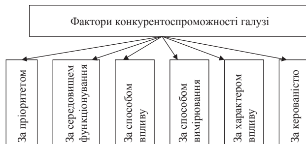
Рис. 3. Класифікація факторів конкурентоспроможності галузі [3]

Класифікація факторів дає змогу оцінити роль і місце кожного фактора у формуванні конкурентоспроможності галузі сільськогосподарського машинобудування. На основі узагальнення праць учених фактори конкурентоспроможності галузі можуть бути класифіковані за такими ознаками (рис. 3).