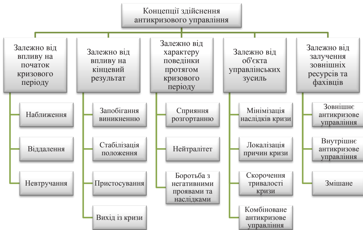
Рис. 3. Класифікація концепцій антикризового управління

Окрім того, поведінка підприємства під час кризи впливає на наслідки, а тому виділяють такі стратегії управління: «сприяння розгортанню» – полягає в реалізації заходів, спрямованих на швидку появу протиріч та активізацію кризових проблем задля їх подолання в першу чергу; накопичення ресурсів, або «нейтралітет» у прийнятті рішень; боротьба з негативними наслідками кризи – передбачає зміни на підприємстві під час кризи задля подолання її впливу. Під час упроваджені антикризового управління менеджери та керівництво підприємства можуть спрямовувати зусилля на подолання наслідків або причин кризи, скорочення терміну впливу негативних явищ або комбінування вищезазначених методів. Залежно від джерела ініціативи, котре наполягає на впроваджені антикризового управління та надає ресурси, виділяють зовнішні (ініціаторами є кредитори, держава тощо) та внутрішні (власники та керівники підприємств) управління. Проте із цієї точки зору найбільш ефективним є комбіноване антикризове управління, яке передбачає використання не тільки внутрішніх ресурсів підприємства, але й усіх доступних, у тому числі зовнішніх.