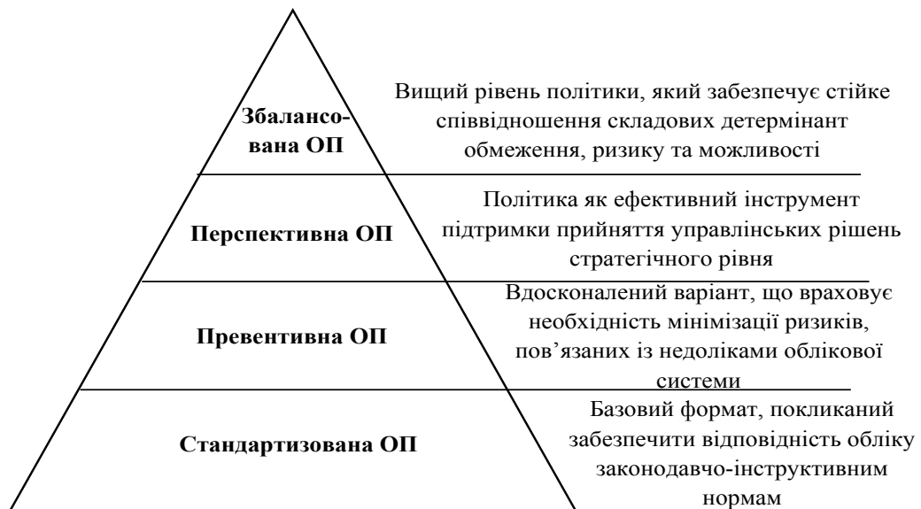
Рис. 2. Ієрархія рівнів облікової політики (ОП)*

2) превентивний (орієнтація на ризики) – облікова політика покликана зменшити можливий негативний вплив від настання несприятливих подій в господарській діяльності організації. В основі її розробки покладено песимістичний сценарій розвитку суб'єкта, за якого ймовірність настання збитків оцінюється високо, а сама облікова політика розглядається як ефективний засіб мінімізації потенційних втрат;