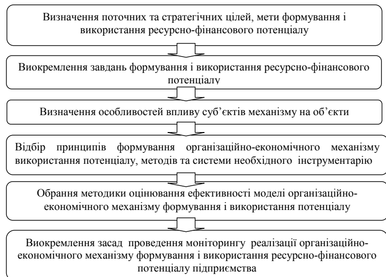
Рис. 2. Етапи побудови моделі організаційно-економічного механізму формування і використання ресурсно-фінансового потенціалу машинобудівного підприємства

Висновки. Ефективність формування та використання ресурсно-фінансового потенціалу промислового