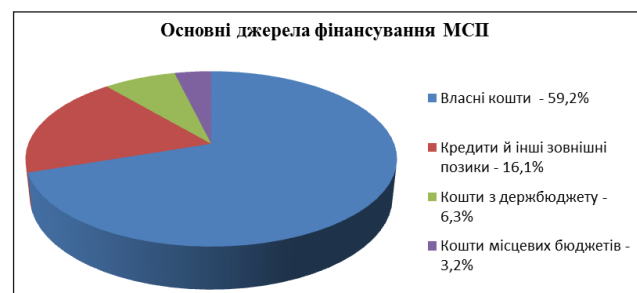
Рис. 2. Основні джерела фінансування МСП в Україні в 2016 році [1]

За даними Державного комітету статистики України у 2016 році [1] основним джерелом фінансування вітчизняного МП залишаються власні кошти підприємств, що склали аж 59,2%, а решта – 40,8% – зовнішні джерела (кредити й інші позики – 16,1%, кошти держбюджету – 6,3% та місцевих бюджетів – 3,2%) (рис. 2). Наслідком обмеженого доступу до ринку позикового капіталу, браком реальних інвесторів може стати втрата ринкових позицій МП.