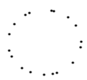
Рис. 2. Сприйняття кола (формування образу кола)

Що ми бачимо? – Коло, що складається з крапок. Не крапки, що формують коло, а саме коло. Форма кола – це гештальт, організуюча сила сприйняття, яка миттєво, швидше, ніж ми можемо усвідомити, накладає на зобра-