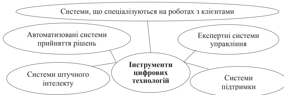
Рис. 2. Інструменти цифрових технологій