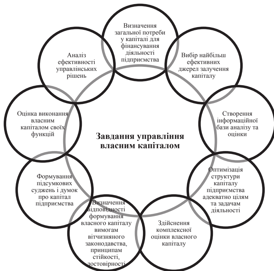
Рис. 1. Завдання управління власним капіталом підприємства

Серед загальних принципів управління власним капіталом підприємства можна виділити: 1) принцип адаптивності, який заснований на тому, що система управління капіталом не обмежується рамками певного підприємства і повинна реагувати на зміни зовнішнього середовища та своєчасно вносити корективи в систему; 2) принцип наукової обґрунтованості передбачає, що система управління власним