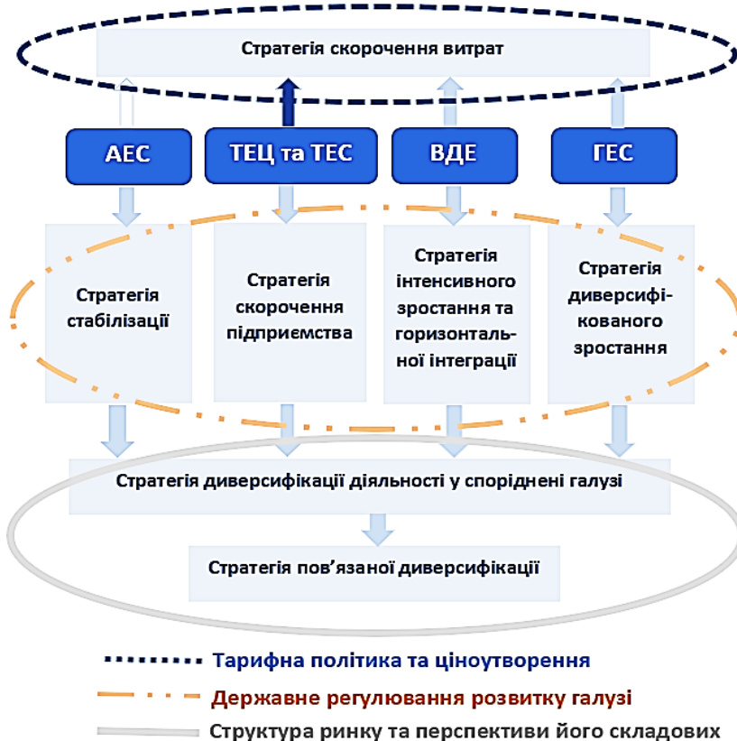
Рис. 3. Формування базових корпоративних стратегій вітчизняних підприємств-виробників електроенергії на сучасному етапі під впливом інституційних факторів