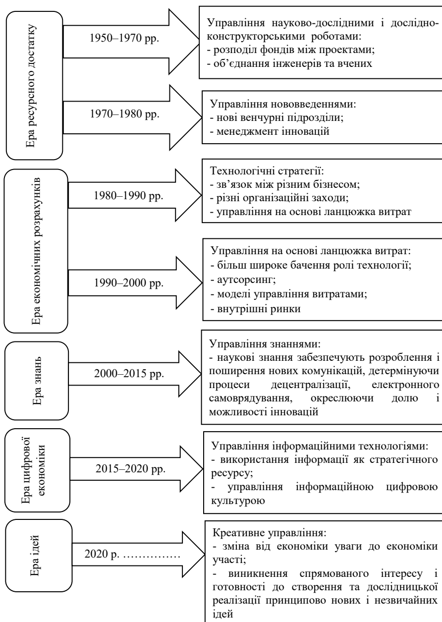
Рис. 1. Виокремлення та реалізація етапів управління інноваційним розвитком на рівні підприємства

Оскільки інновації є унікальним ресурсом підприємства, то керівництву підприємства необхідно звернути увагу на систему управління інноваційним розвитком підприємства. Інноваційний розвиток підприємства повинен бути взаємопов'язаний з інтелектуалізацією діяльності, використовуючи всі наукові знання та їх трансформацію в інноваційні наукові технології і технологічні рішення.