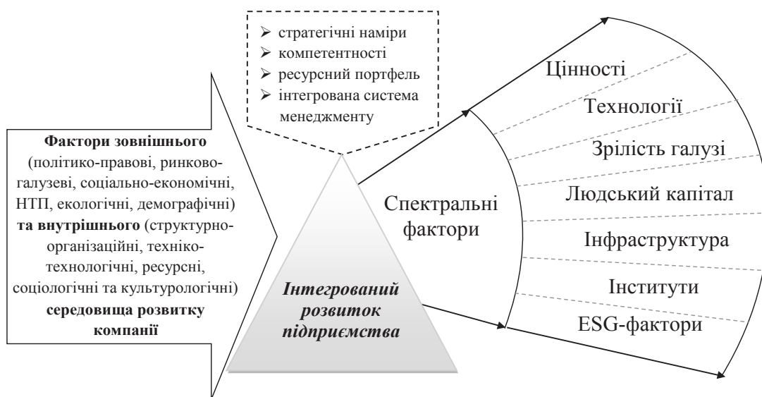
Рис. 1. Призма факторів інтегрованого розвитку підприємства

Слід також зауважити, що в сучасних умовах господарювання підвищується увага міжнародних і національних фінансових інститутів до виокремлення екологічних, соціальних, управлінських аспектів результативності розвитку підприємства (ESG-факторів), а також відбувається посилення вимог корпоративних регуляторів до оцінювання впливу компаній на соціально-економічний розвиток регіону і місцевої громади, підвищення ступеня відкритості корпоративної інформації на основі проведення незалежних досліджень національних індикаторів стійкого розвитку діяльності компаній з урахуванням ESG-факторів і нефінансових показників результативності компанії.