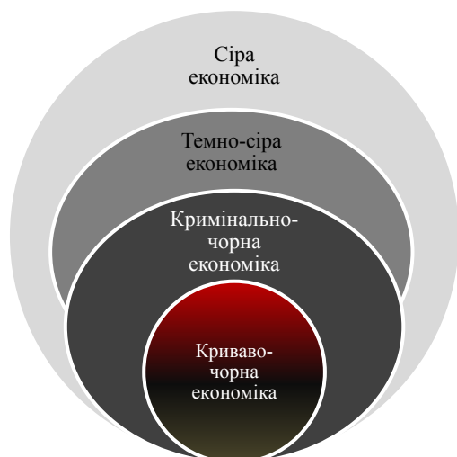
Рис. 1. Рівні тіньової економіки

З.С. Варналій виділяє три основні складники тіньової економіки [3]: неофіційна економіка, кримінальна економіка; ілєгальна економіка. Службовець Національного агентства України з питань виявлення, розшуку та управління активами, одержаними від корупційних та інших злочинів, С.О. Баранов у своїй дисертації вказує на присутність в Україні трьох її основних елементів: неформальної, прихованої й підпільної (кримінальної) економіки.