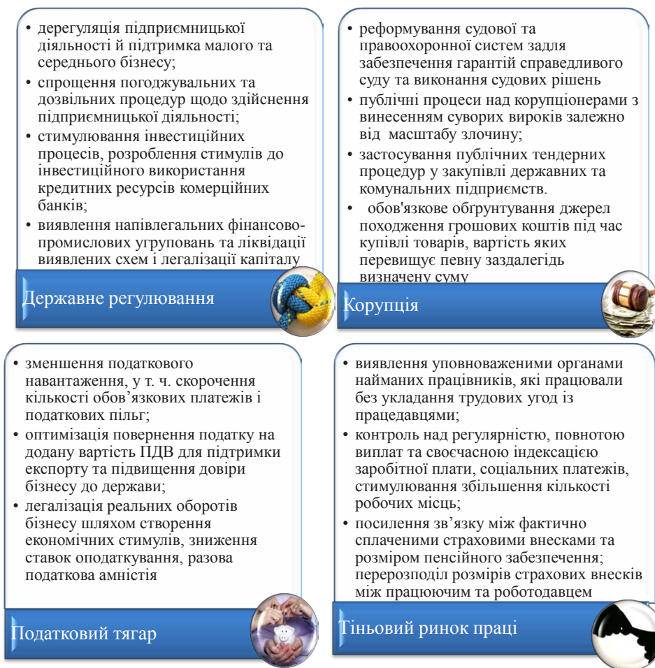
Рис. 3. Напрями детінізації економіки

пов'язана з неофіційним працевлаштуванням, зокрема використання праці найманих працівників без укладання трудових договорів і угод, виплата зарплати «в конвертах», ухиляння від сплати податків, соціальних внесків, неоплачуваній понаднормованій час роботи, лікарняні, відпустки, порушення роботодавцями інших вимог трудового законодавства.