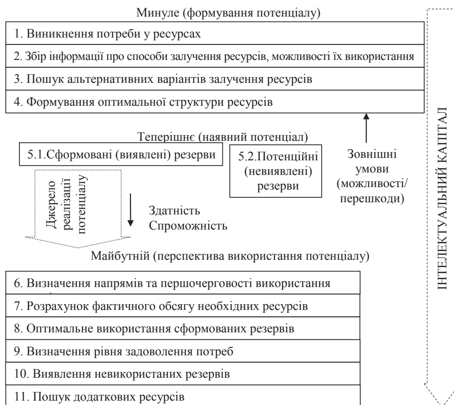
Рис. 1. Процес формування та реалізації економічного потенціалу підприємства

Джерело: удосконалено автором за даними [4, с. 8]