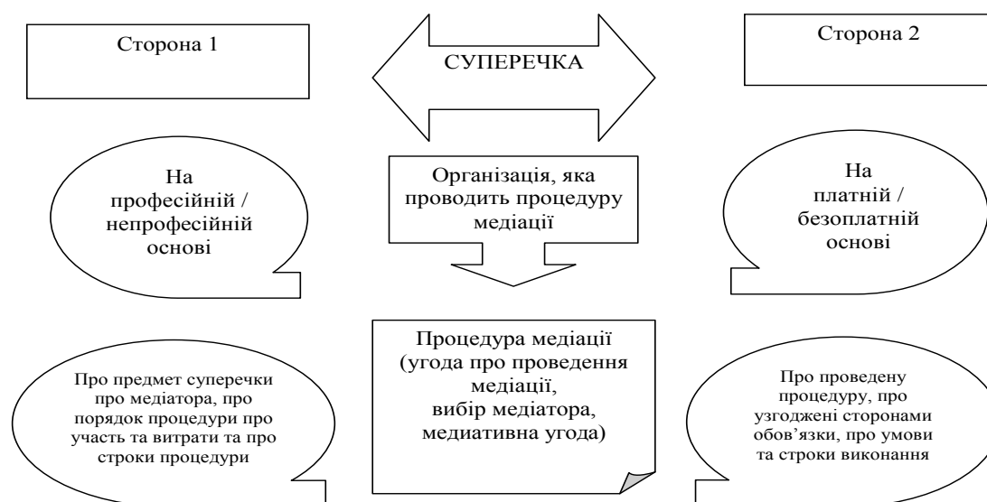
Рис. 1. Схема організації проведення медіативної процедури