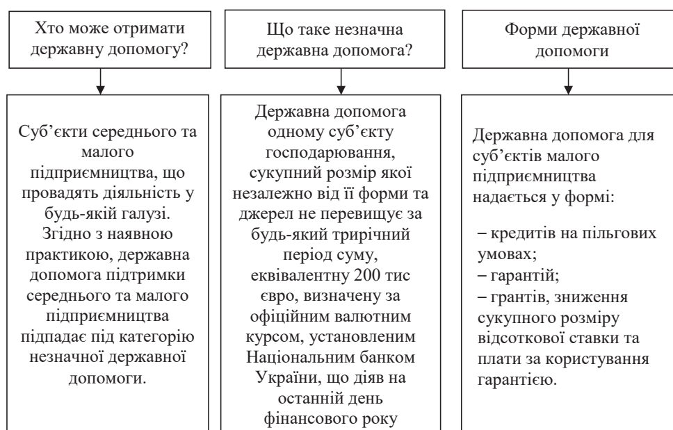
Рис. 2. Державна допомога суб'єктам малого та середнього бізнесу [6]

У цей складний час уряд запровадив низку програм для підтримки мікро-, малого, середнього бізнесу.