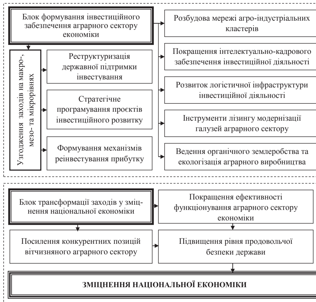
Рис. 4. Організаційно-економічний інструментарій покращення інвестиційного забезпечення розвитку аграрного сектору національної економіки