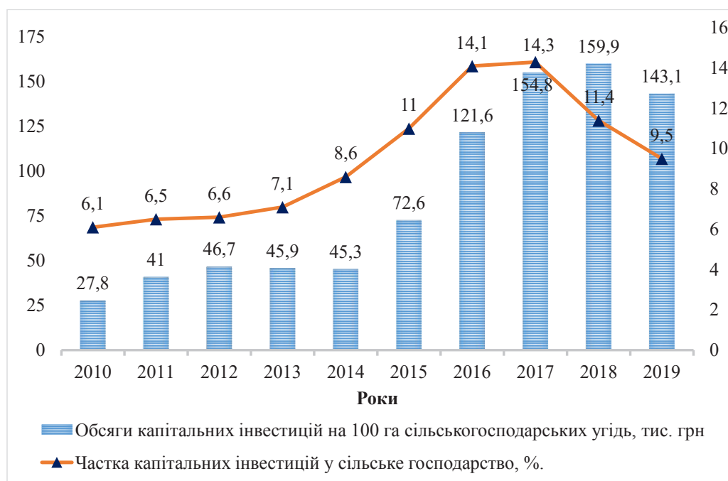
Рис. 1. Динаміка капітальних інвестицій в сільське господарство України у 2010–2019 роках

Як ілюструють дані рисунка 1, у 2010 році частка капітальних інвестицій у сільське господарство складала 6,1%, у 2018 році – 14,3%, а у 2019 році знизилася до рівня 9,5%. Щодо обсягу капітальних інвестицій