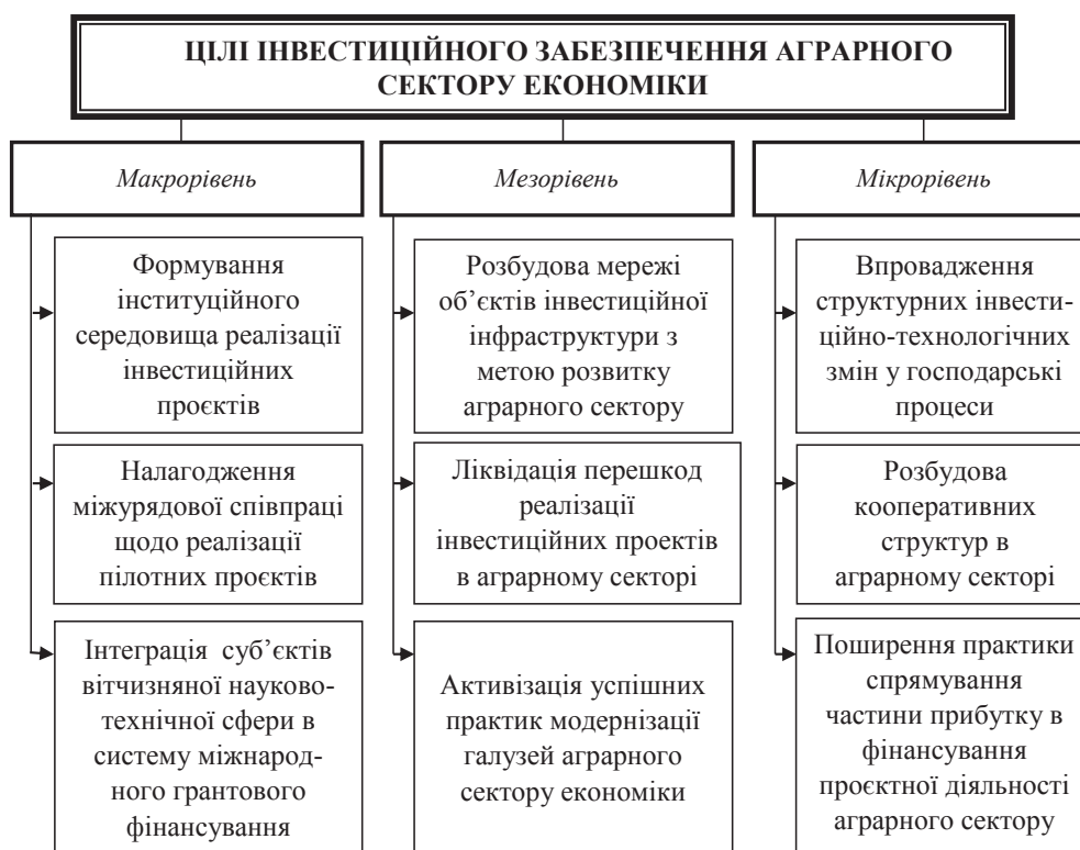
Рис. 3. Пріоритетні цілі інвестиційного забезпечення розвитку аграрного сектору національної економіки