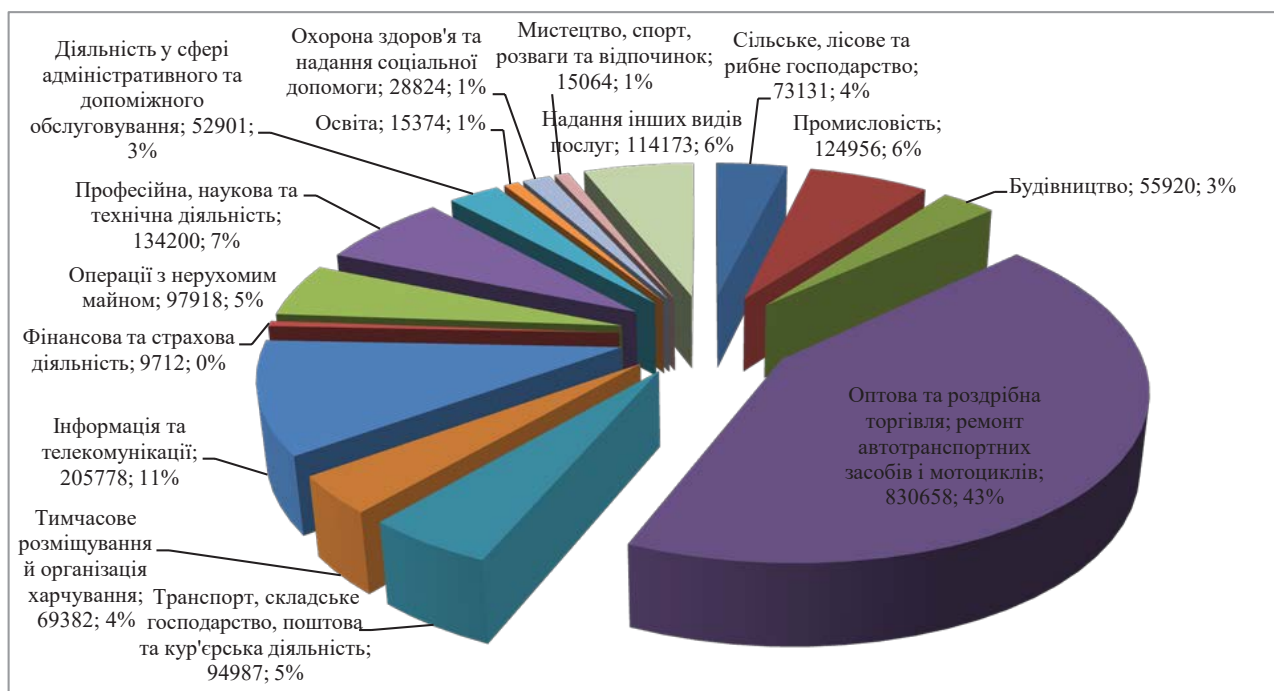
Рис. 3. Структура суб'єктів малого підприємництва в Україні за видами економічної діяльності у 2019 р., одиниць, %