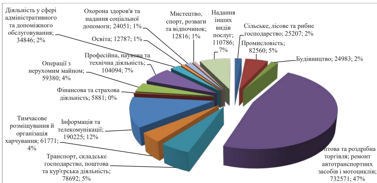
Рис. 5. Структура суб'єктів малого підприємництва фізичних осіб – підприємців за видами економічної діяльності в Україні у 2019 р., одиниць, %

теми. У такому разі відбувається адаптація еталонного зразка (бажаного стану системи) до умов зовнішнього середовища, в якому функціонує суб'єкт підприємництва. Із метою досягнення бажаного стану системи формується програма адаптаційних заходів. Таку адаптацію можна назвати еталонною. Прикладами еталонної адаптації є варіанти застосування передового міжнародного досвіду розвитку малого підприємництва, зокрема у тій його частині, що стосується нормативно-правового забезпечення, надання фінансово-кредитних послуг, здійснення «економічного прориву», фасилітації тощо.