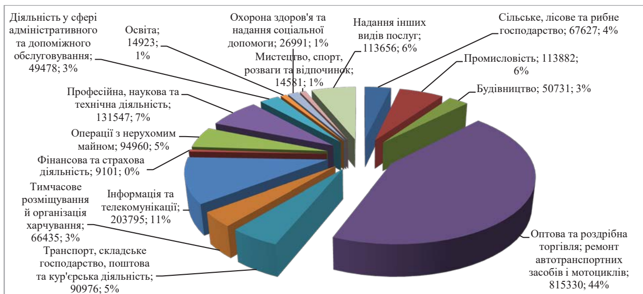
Рис. 4. Структура суб'єктів мікропідприємництва в Україні за видами економічної діяльності у 2019 р., одиниць, %