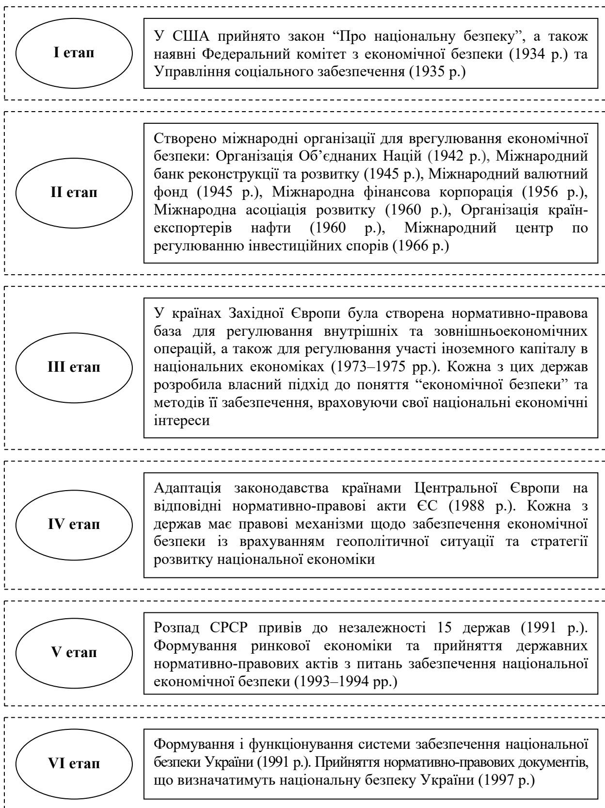
Рис. 1. Етапи розвитку категорії економічна безпека