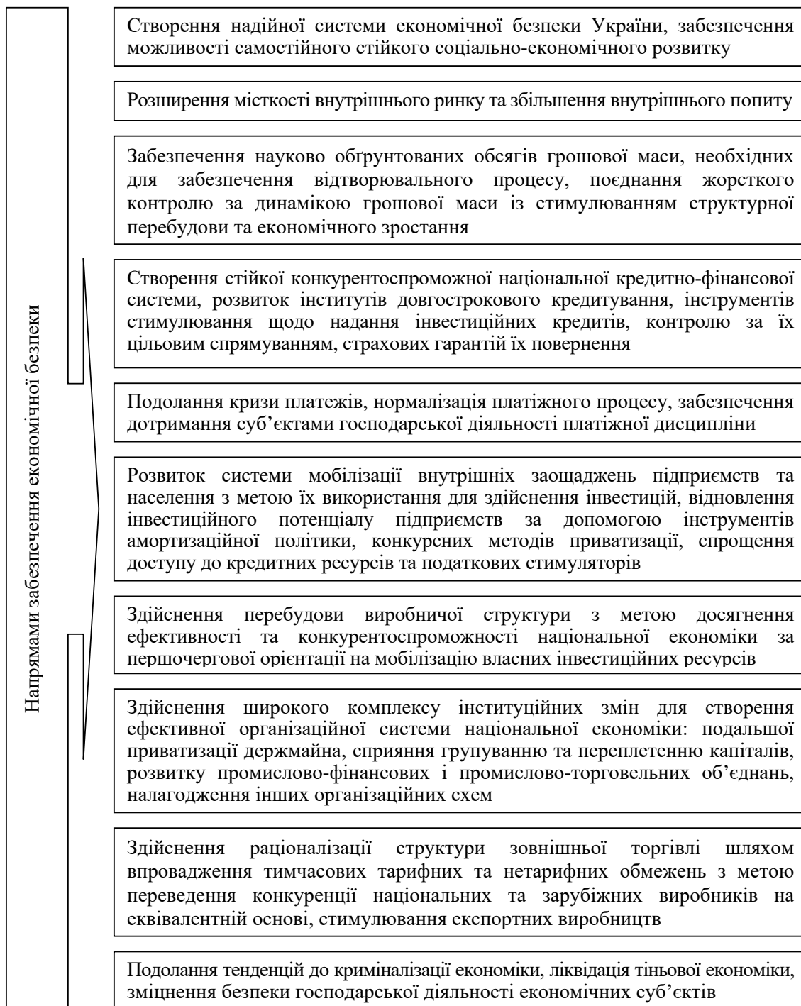
Рис. 5. Основні напрями забезпечення економічної безпеки України

Джерело: розроблено автором за даними джерела [4, с. 92]