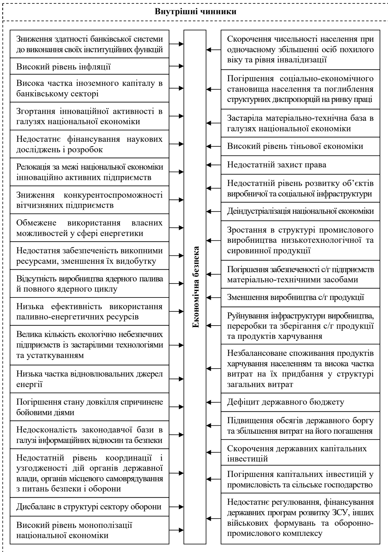
Рис. 3. Основні внутрішні чинники загроз економічній безпеці України