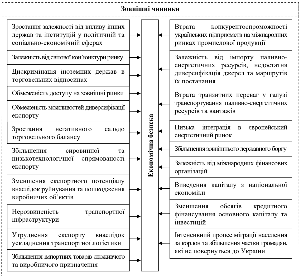
Рис. 2. Основні зовнішні чинники загроз економічній безпеці України