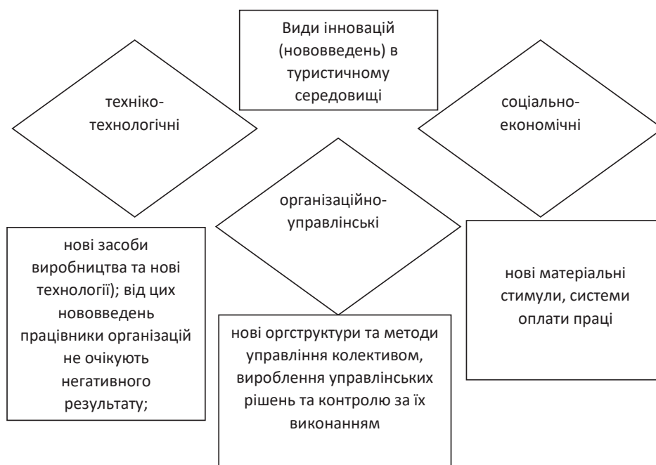
Рис. 2. Види інновацій (нововведень) в туристичному середовищі